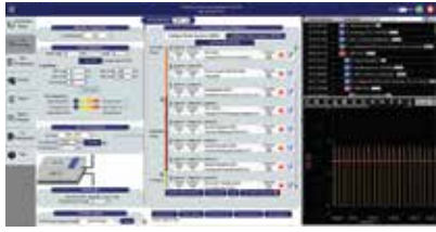
通過自定義模式, 超越一致性測試調適產品