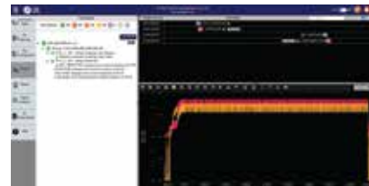
體驗簡單化的身份驗證和調試過程