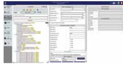
引領全自動化一致性測試